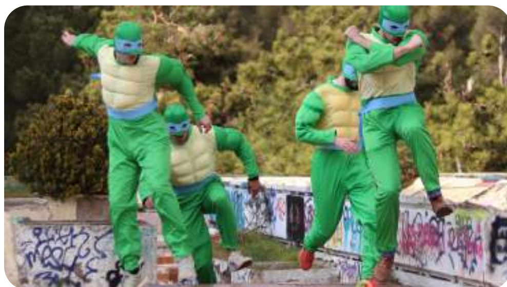
Liste Tortues Minja