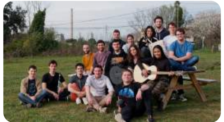
Une passion réussie