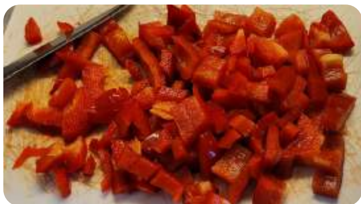
Poivrons découpés en cubes