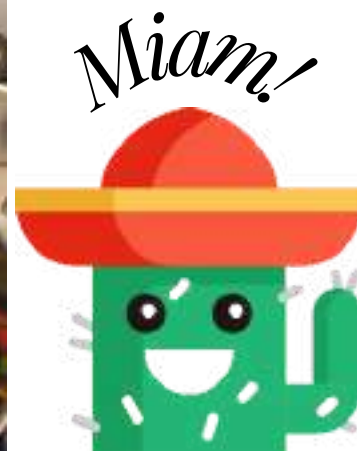
Légumes et eau à bouillir

7. Une fois la viande et les légumes cuits, verser le riz et les haricots rouges avec leur jus dans le fait-tout, remuer et couper le feu.